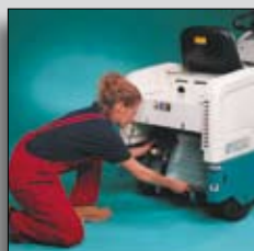
Schimbare a filtrului fără dispozitive adiționale