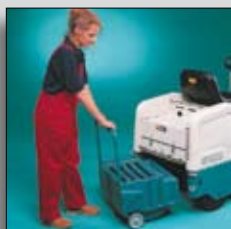
Recipient ce alunecă în afară