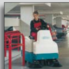
Mașină în funcțiune