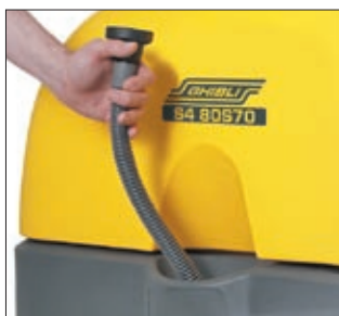
Carico acqua con apposito tubo Water filling system with hose