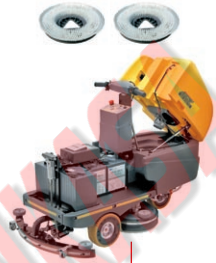
Caricabatterie a bordo per versione BC Charger on board for BC version