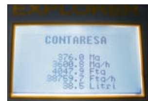
Display impostazione parametri

While the displayed "partial" values are resettable, the "total" value is stored inside the card.