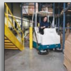
Mașină în funcțiune