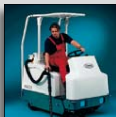
Protecție în partea superioară & aspirator