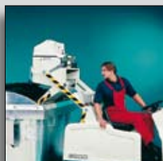
Recipient cu aruncare de la înălțime