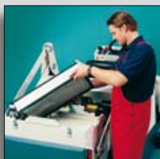
Schimbare a filtrului fără dispozitive adiționale